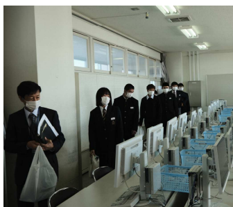
校舎見学(コンピュータ室・屋内練習場)