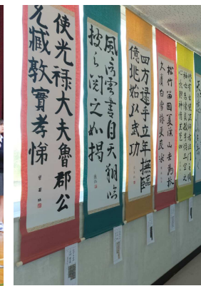
書道部の作品展示