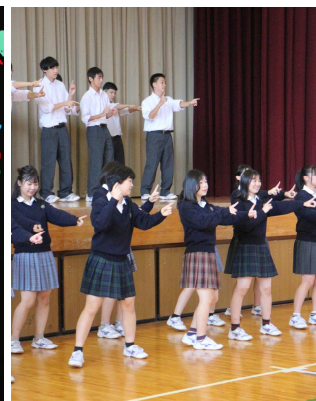
クラス全員でダンス